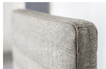
Solitaire vollupolstert mit Steppung