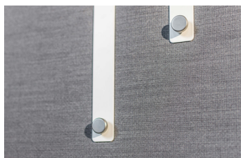
Orgazubehör - Kleiderhaken