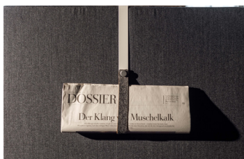
Orgazubehör - Prospektschlaufe