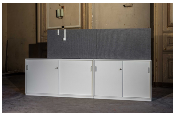
Schrankaufsatzelement mit Orgazubehör