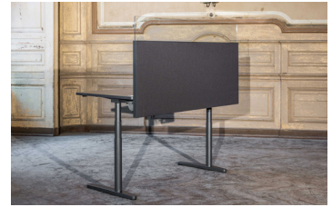
Tischelement mit Glasaufsatz