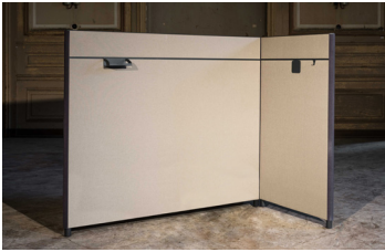
Vollwand mit Orgaschiene