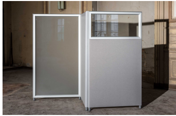
Glaswand und teilverglaste Wand